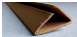
• Clip «U»