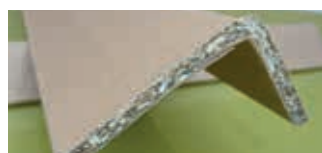
• Ali asimmetrici