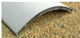
• Profilo «C»