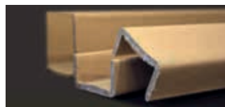
• Profilo «U»