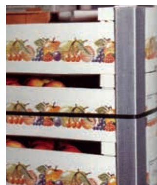
• Protezione contro l'umidità

(*) PRODOTTO FABBRICATO FUORI LA FRANCIA