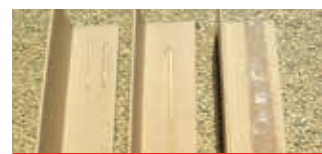
• Adesivo – diversi tack