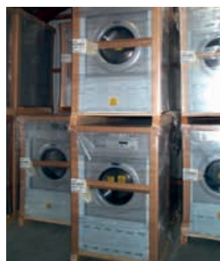
• Alta resistenza