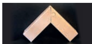
• Angolare tipo puzzle (*)