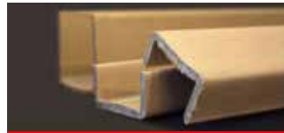
• Perfil «U»