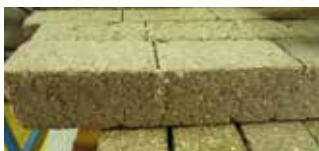
• Barra espaciadora