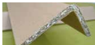
• Ala asimétrica