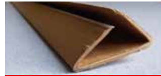
• Clip «U»