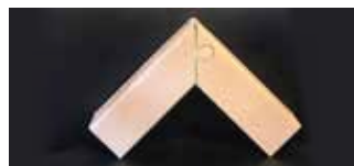
• Protección de esquinas tipo «puzzle» (*)