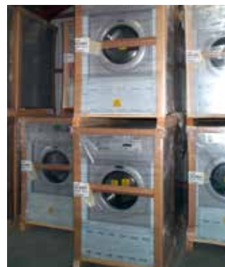
• Alta resistencia