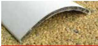
• Perfil «C»