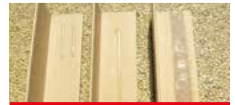
• Adhesivo: tachuelas diferentes