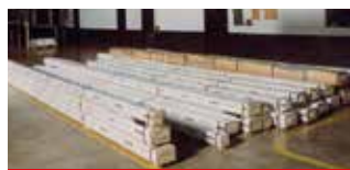
• Exemple d'application