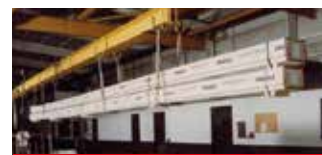
• Exemple d'application