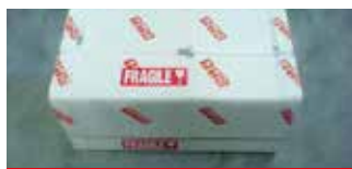
• Impression 2 couleurs maximum