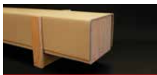
• Reddi-Crate® assemblé (option)