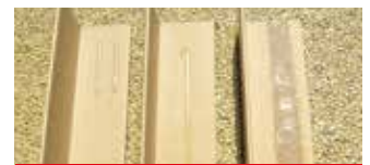
• Adhésive : tacks différents